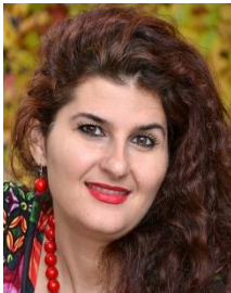
Sulea Kasmi Spielgruppe Primano Familien - mitten unter uns